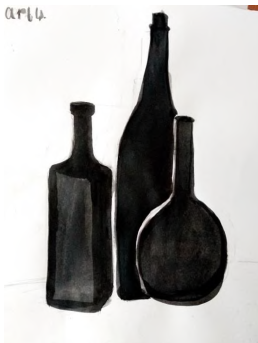
Дарья К., 10 лет