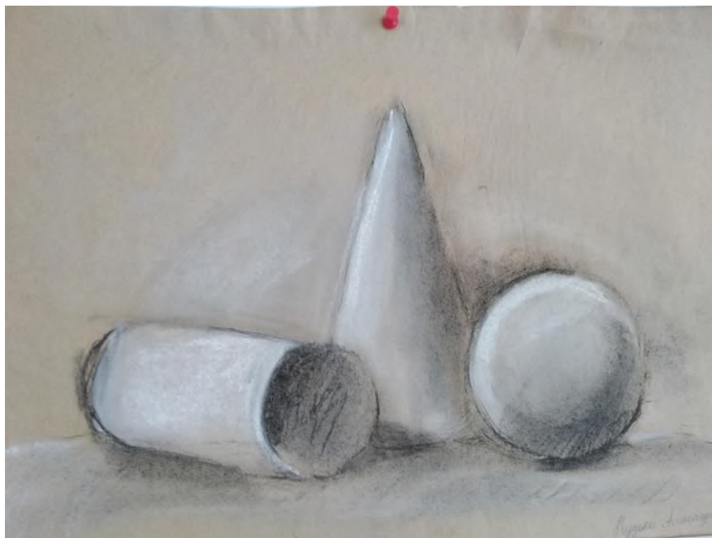
Рис. 1, Дарья К., 10 лет