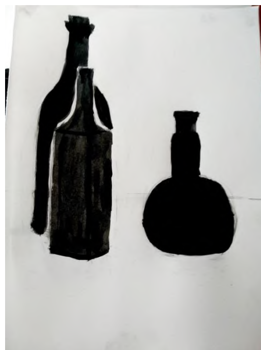
Тимофей Б., 10 лет