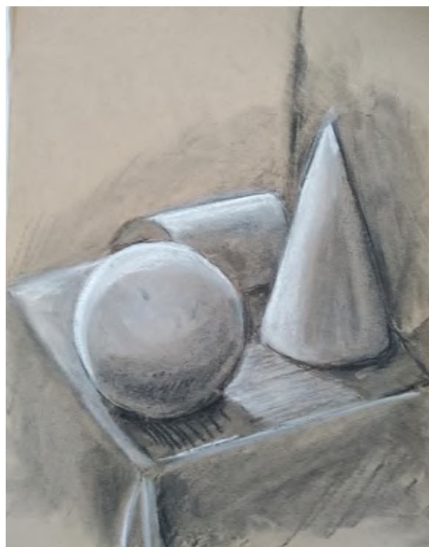
Рис. 2, Василина К., 10 лет