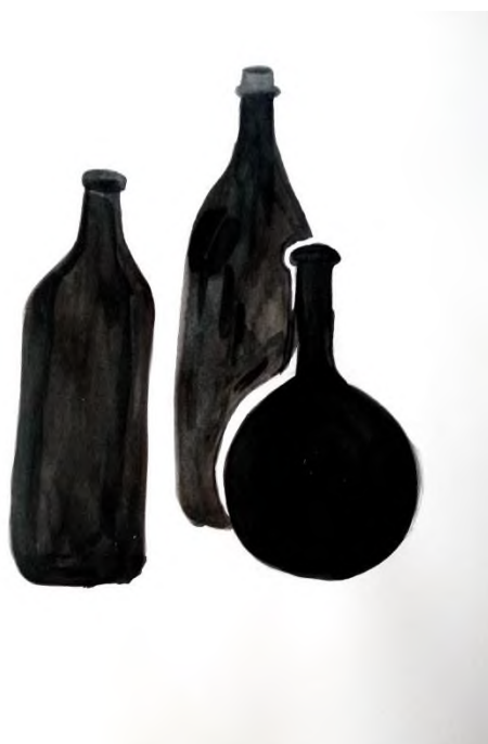
Юлия Г., 10 лет