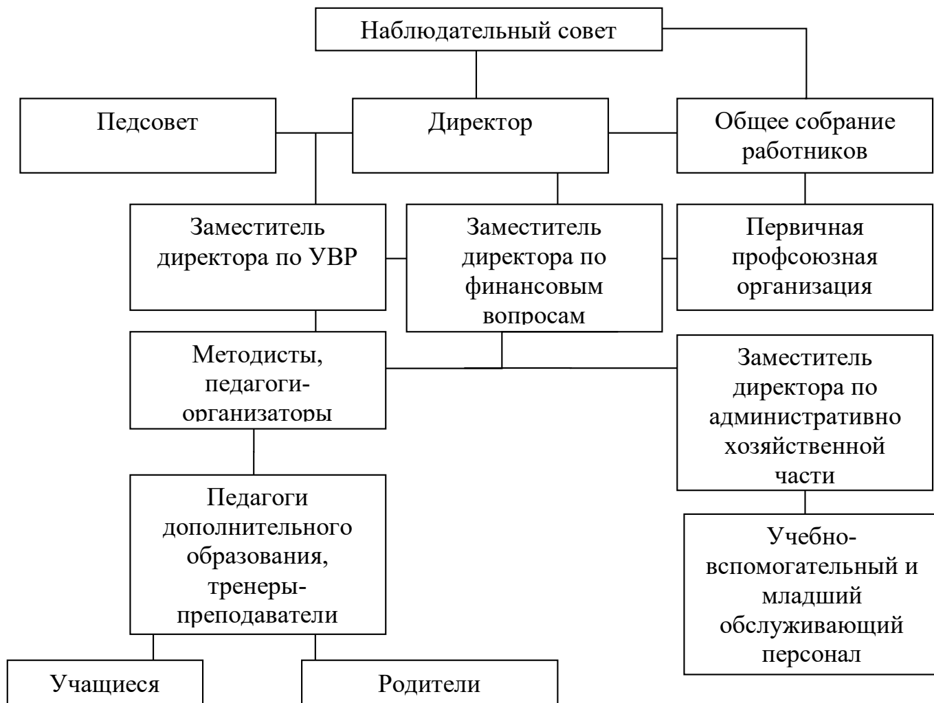
Рисунок 1. Структура управления МАУДО ЦДО

31 декабря 2018 года в учреждении прекратил деятельность Экспертно-методический совет. Функции данного Совета с 01 января 2019 года выполняет Педагогический совет.